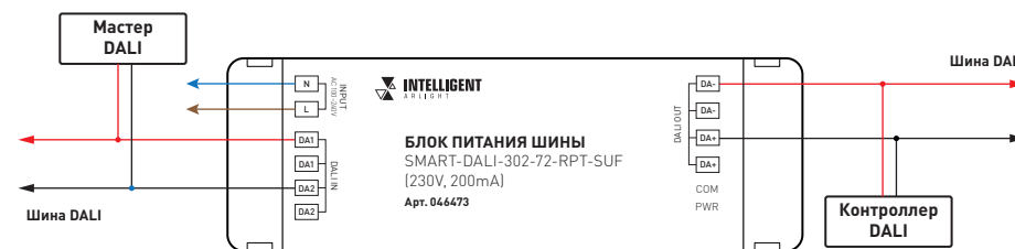
Рис. 1. Схемы подключения блока питания